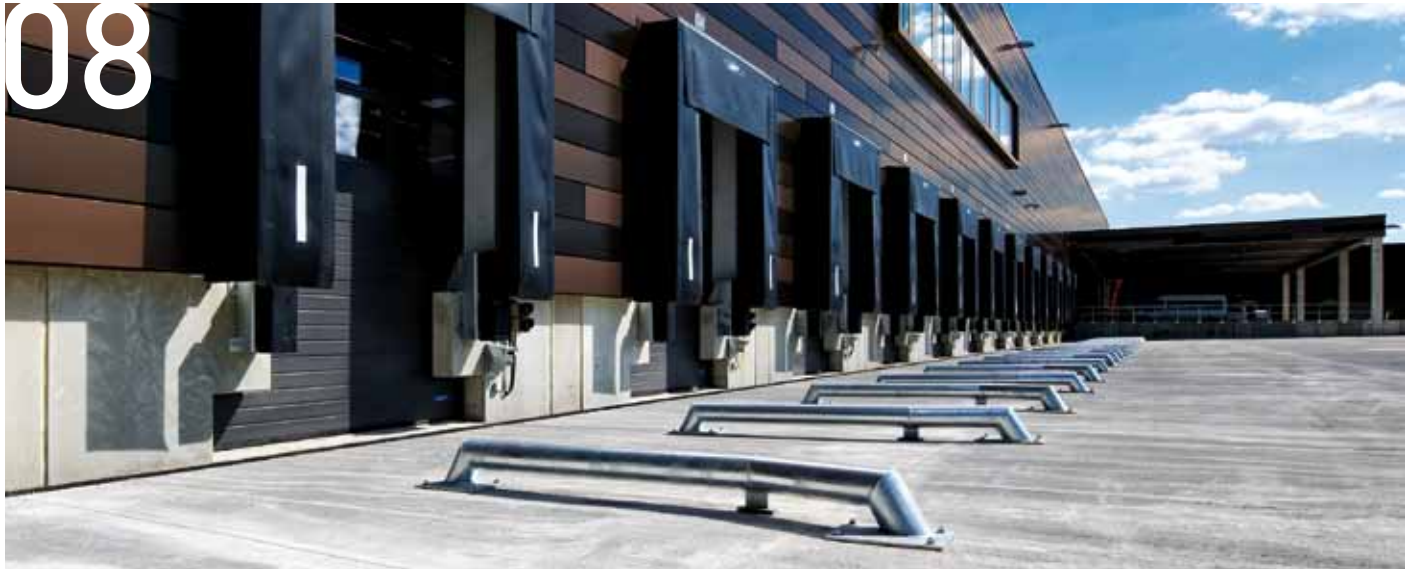
Ipari és logisztikai megoldások