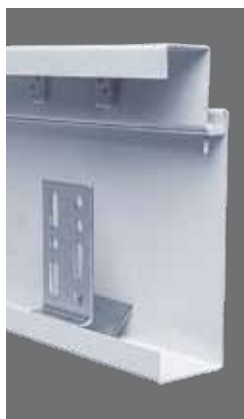
Kétrészes keret utólagos beépítéshez