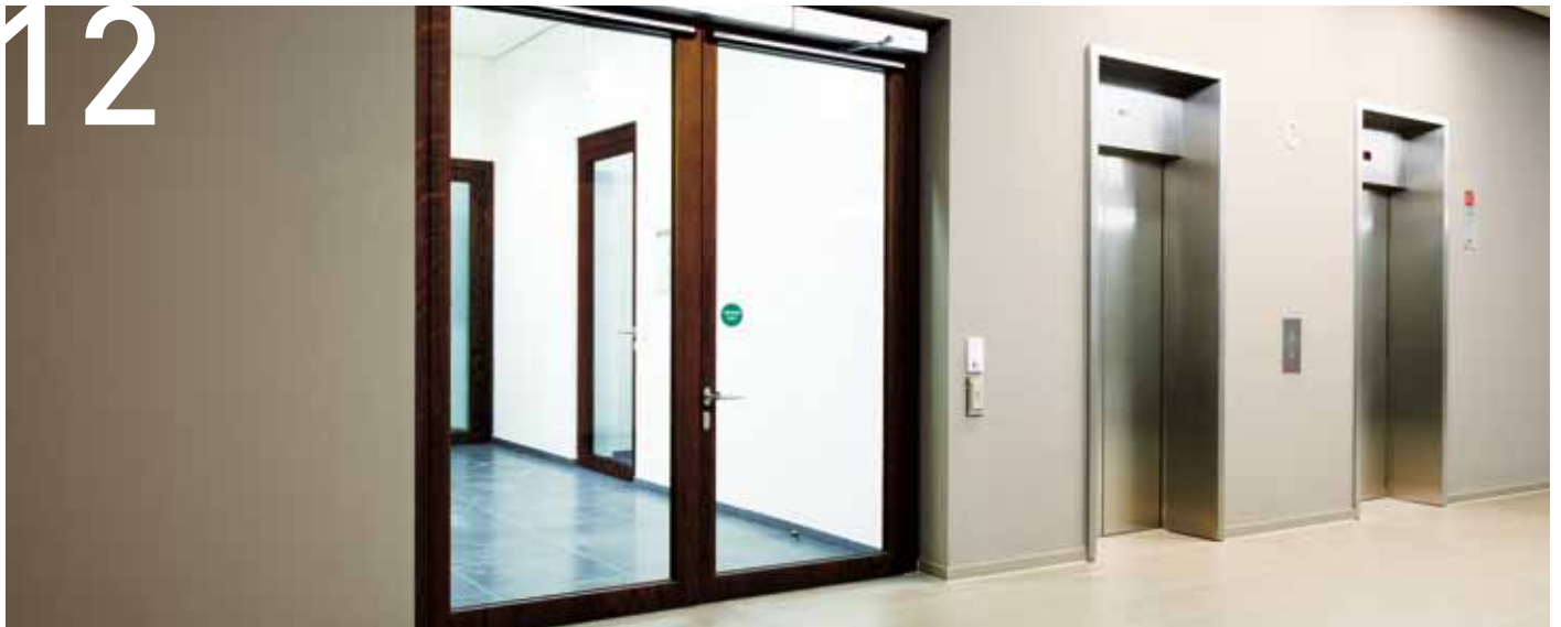
Tűzgátló, biztonsági és bejárati megoldások