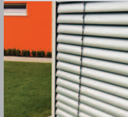
Vezetősínes peremezett lamella