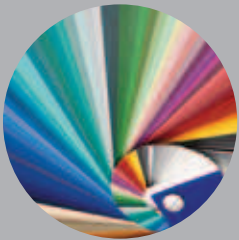
A lamella színei a 33. oldalon található

rozó építészeti elem is. A beeső fény mennyisége igény szerint szabályozható, így a helyiségek megvilágítása éppen aktuális tevékenységünknek megfelelően történhet. A ROMA homlokzati zsaluziái külsőtokes, rejtett tokos, vezetősínes, zsinóros, vagy konzolos kivitelben készülnek.