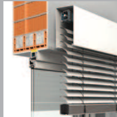
Konzolos rendszer szögletes védőtetővel (lekerekített formában is kapható)