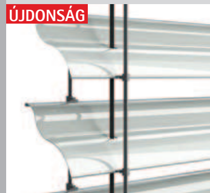
A DBL-lamella hullámos felületén különleges fényhatások alakulnak ki.

Tökéletes árnyékolás optimális fényviszonyok mellett! A ROMA új alumínium zsaluzia rendszerének különlegessége, hogy a lamellázat felső harmada külön mozgatható. Míg az alsó kétharmad rész összezárva árnyékol és véd a betekintéstől, addig a felső harmad tetszés szerint elfordítható.